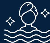
Piscina lúdica tipo spa