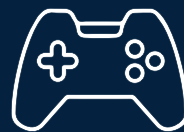
Salón de videojuegos