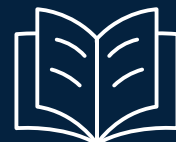
Salón de lectura y coworking