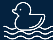
Piscina niños con juegos acuáticos