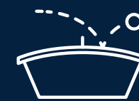
Zona de Teqball al descubierto