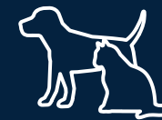
Zona para mascotas