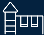
Juegos infantiles descubiertos